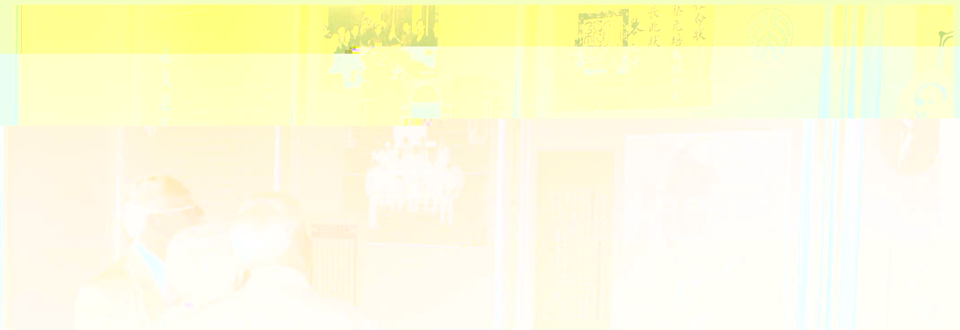
圖為蔡元培先生在北京大學教育學院展覽開幕式上與嘉賓合影

展覽開幕式(日期:2010-10-01) 蔡元培先生中國留學歐洲時期、五四運動、風潮北京軍閥時期、曾任中華教育學會總幹事、北京大學校長、自由黨黨魁等時期照片、畫作、手稿、書信、紀念品、書籍、銅像、照片等。展覽內容豐富而生動，展現了蔡元培先生的人生軌跡。此外，北京大學教育學院還將舉辦多場講座、研討會、展覽等活動，邀請專家學者對蔡元培先生的教育思想進行深入探討。此次展覽不僅是蔡元培先生生平的回顧，也是對其教育思想的傳承和弘揚。展覽時間為2010年10月1日至10月31日，地點為北京大學教育學院展覽廳。